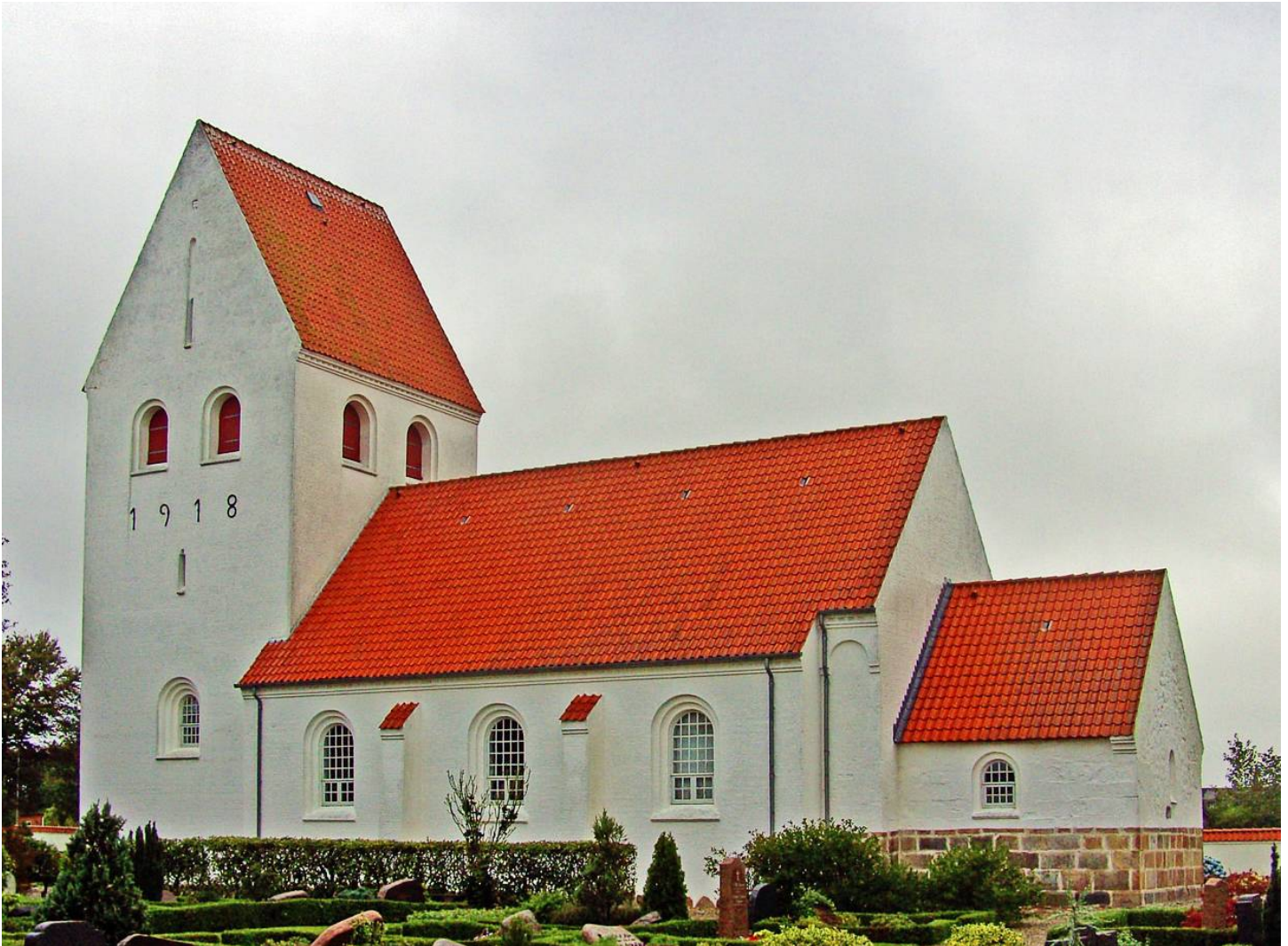
Thisted Amt, Refs Herred, Jegindø Parish

Picture of Jegindø Church by Claude David